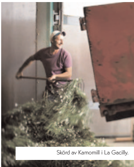
Skörd av Kamomill i La Gacilly.